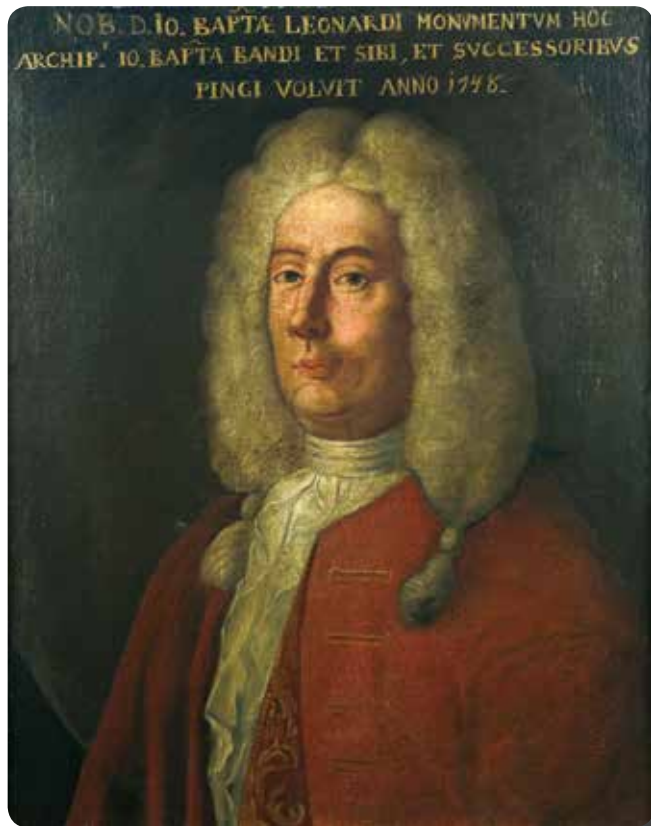
Giovanni Battista Leonardi, ideatore della Congregazione