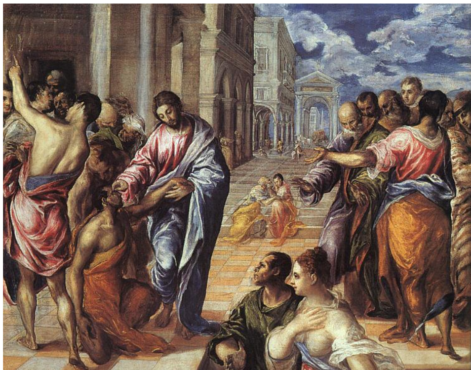
El Greco, "Gesù Cristo guarisce il cieco nato", 1570 - New York